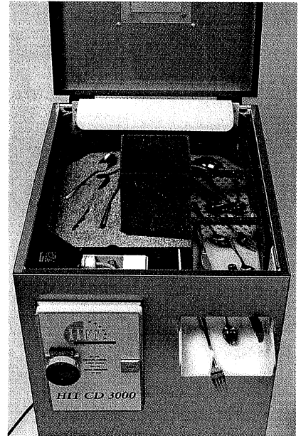
Die Besteckpoliermaschine gibt es in 3 verschiedenen Größen von 3000 bis 10 000 Besteckteilen in der Stunde.

In allen Großküchenbetrieben muss das Besteck nach dem Spülen von Hand abgetrocknet werden, um Wasserflecken zu entfernen. Dies ist zeit- und damit auch kostenintensiv. Selbst wenn aus Spülstraßen die Bestecke vermeintlich getrocknet austransportiert werden, so sind dennoch Wasserreste vorhanden, die auf den Bestecken Kalkränder entstehen lassen. Die einfach zu handhabende Besteckpoliermaschine aus dem Hause Thomas Dörr spart Zeit und Geld. Das Besteck wird im nassen Zustand direkt aus